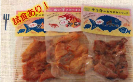
そう介・あい子おつまみシリーズ 各¥300- (うまっから・しお・しょうゆ味)