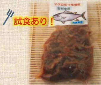
マグロモツ入りきんぴら ¥500-