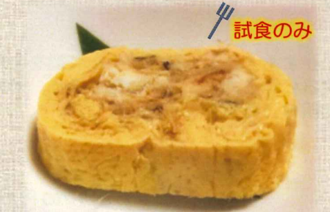
あなご出汁巻き卵

※写真は一部商品のイメージです。売り切れ御免で厳選の水産加工品25品目を取り揃えてお待ちしております。(価格は税込みで表示しています。)