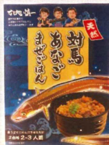
対馬あなごまぜごはん ¥1,080-